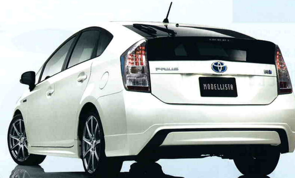
Photo:AERO TOURER S キット(ベース車両はG)、ボディカラーはホワイトパールクリスタルシャイン(070)はメーカーオプション。ソラーブ(付)付ムールーフ、ソラーベンチレーションシステムとLEDライトアップコンシステムはセットでメーカーオプション。寒冷地仕様、リヤフォグランプはセットでメーカーオプション。AERO TOURER S キット:ローダウンスプリング、18インチアルミホイールとタイヤセット(ウェッズ ローレッシュK&Kハイパーシルー)とエコハマタイヤ DNA Earth-1はモデリスタパーツ(販売店装着オプション)。※写真は灯火類を点灯させた状態です。