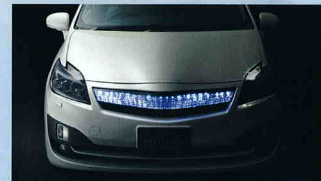
303 LEDインナーグリルキット※車幅灯連動式 設定:AERO TOURER S キット(301)、AERO TOURER キット(303)装着車 63,000円(消費税抜き60,000円) (070) ※写真の色や輝度は実際とは異なります。