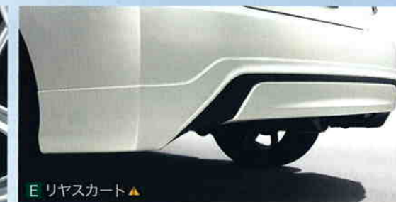
E リヤスカート ▲

材質: PPE 地上高: オリジナルより約5mmダウン(リヤバンパーポイラー付車) オリジナルより約10mmダウン(リヤバンパーポイラー無車)