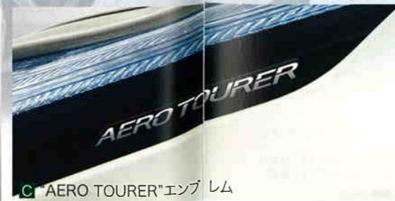
C "AERO TOURER"エンブレム