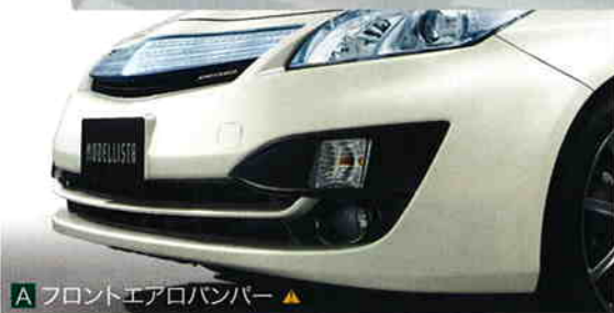
A フロントエアロバンパー ▲

305 AERO TOURER キット A+B+C のセット 設定: 除くG*ツアリングセレクション・レザーパッケージ、Lおよびブリクラッシュセーフティシステム(ミリ波レーダー方式)、レーダークルーズコントロール(ブレーキ制御付)装着車 塗装済 221,550円(消費税抜き211,000円) (070) (WA25) 素地 202,650円(消費税抜き193,000円) (070) (6.0) (WA26) リヤバンパーポイラー(無車用(WA24))