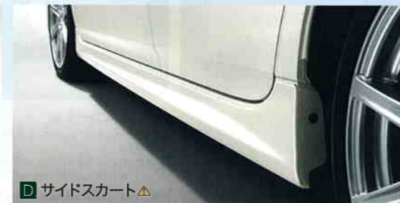
D サイドスカート ▲